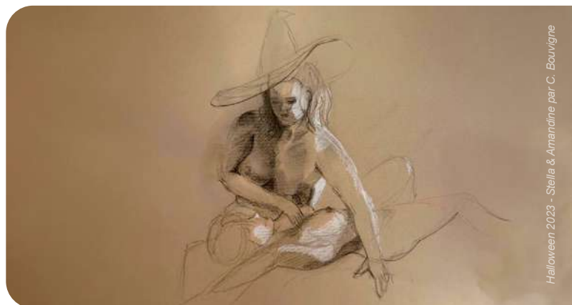
Halloween 2023 - Stella & Amélie par C. Bouvigne

Plus de temps, plus d'inspiration, plus de plaisir !