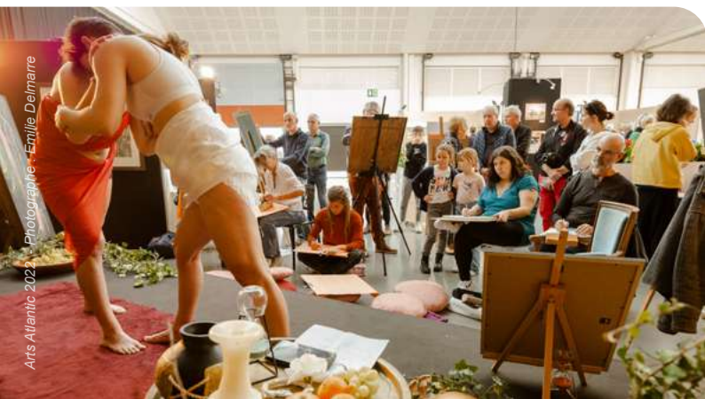
Arts Atlantique 2022