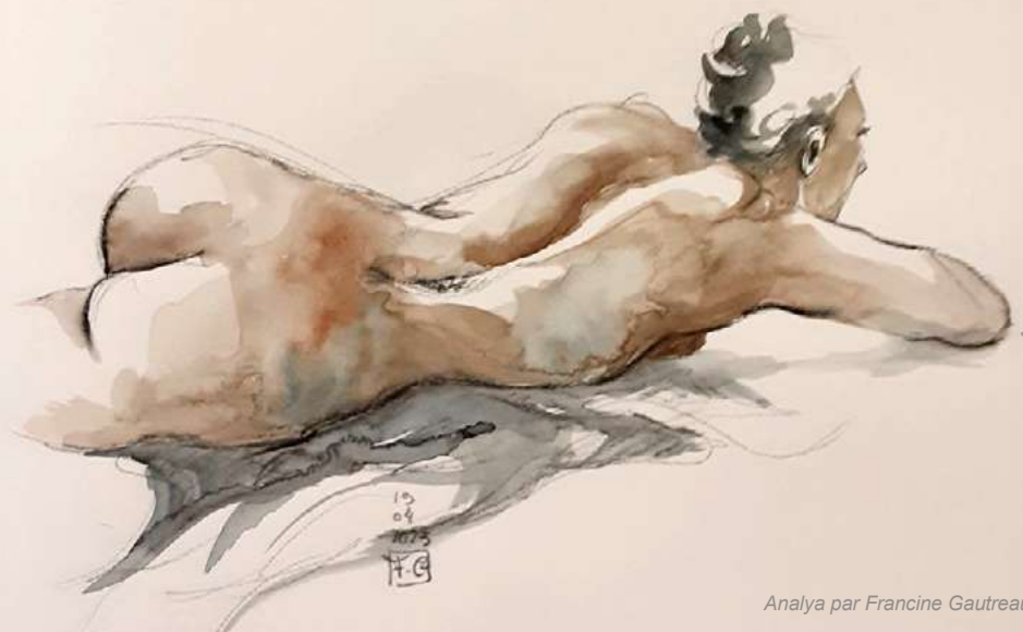
Analya par Francine Gautreau

L'association Corps & Arts est spécialisée dans le modèle vivant. Notre objectif est de créer une communauté pour les artistes, les modèles & les amateurs d'art, de stimuler la créativité et d'encourager la participation à des activités liées à l'art.