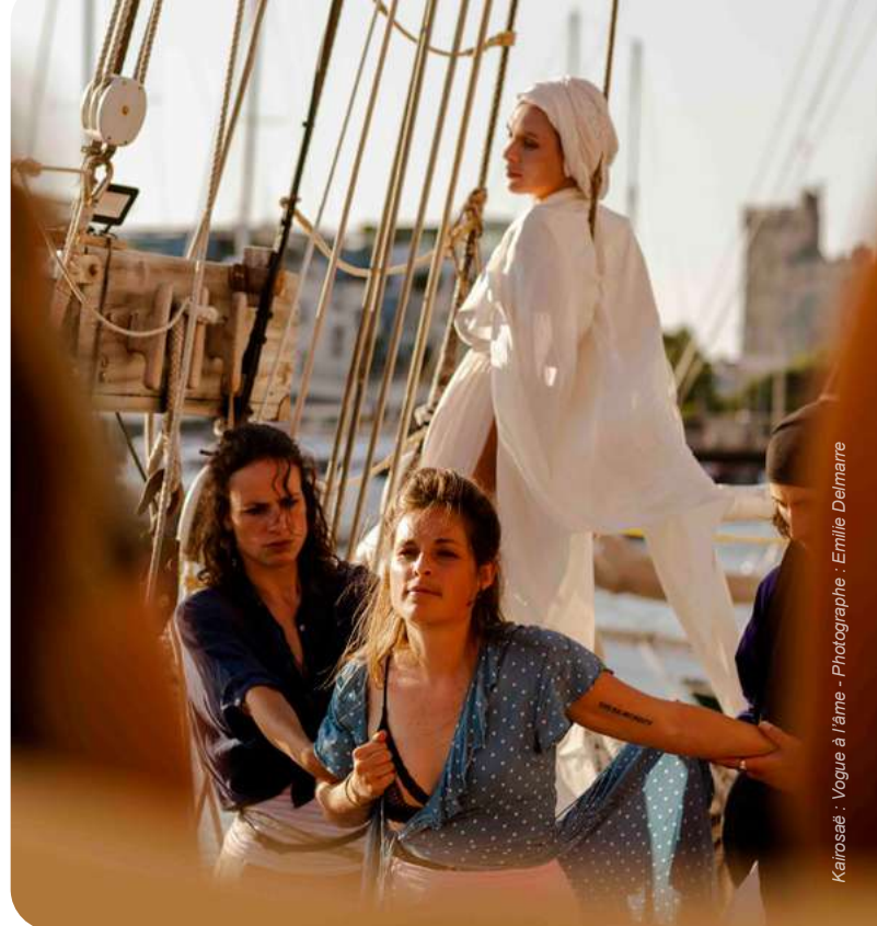
Kairosae : Vogue à l'âme - Photographe : Emilie Delmarre

Rendez-vous annuel : Le Banquet à Croquer