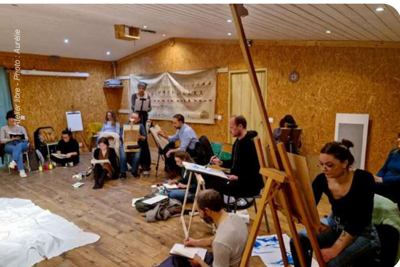
Atelier libre